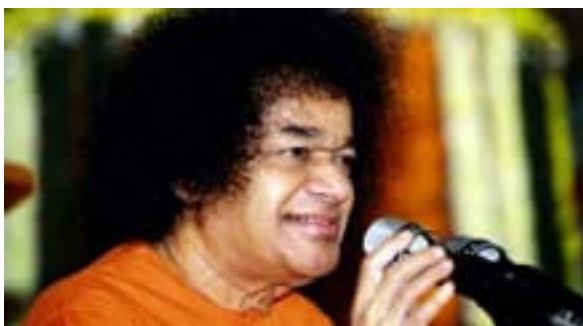
Sathya Sai Baba

Je souhaite que vous preniez les rênes de la direction et apportiez la paix et la prospérité à la nation en menant une vie idéale.”